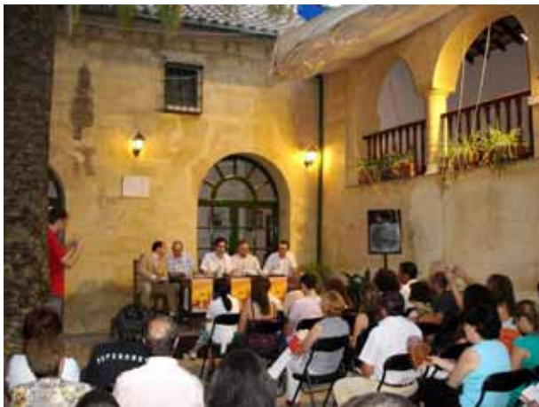
Acto de entrega de premios