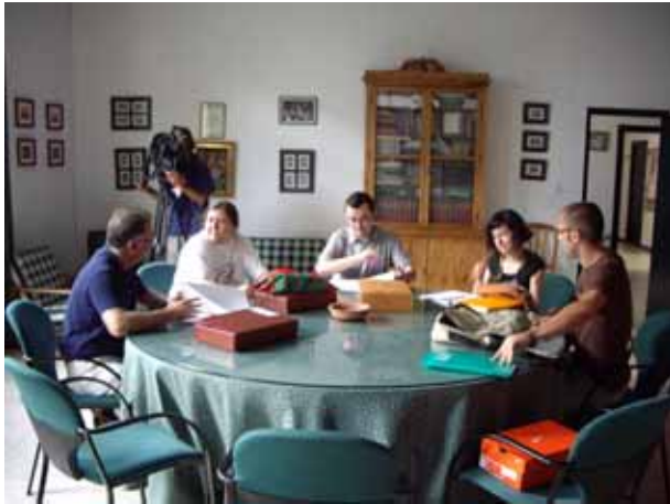
Reunión del jurado de relato corto