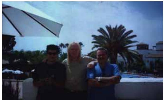
Estepona (Málaga), 21 de julio de 2003. Rick Wakeman (teclista de Yes), mi hijo y el que escribe este artículo

Concluiré diciendo que los tiempos pasan pero que el espíritu y el amor a la buena música persisten y persistirá en aquellas personas que seguimos asistiendo a los conciertos.