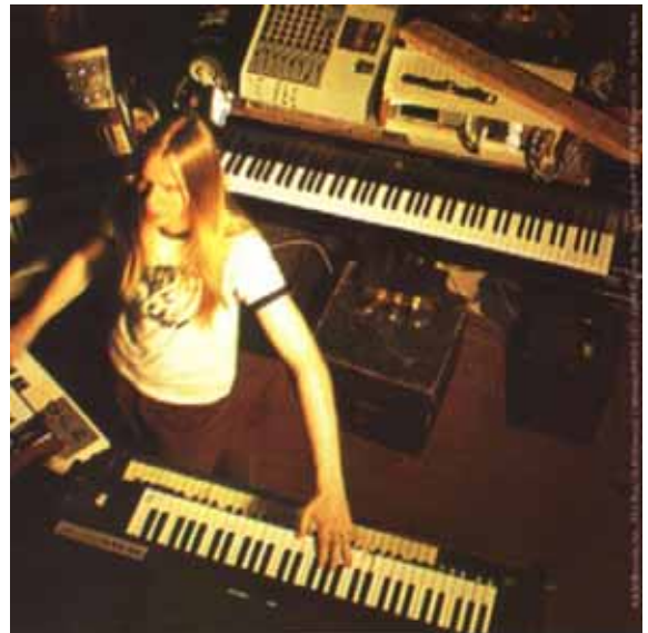
Rick Wakeman en “Las seis esposas de Enrique VIII”

La pandilla nos preparábamos con gran ilusión para los eventos musicales: teníamos nuestra ropa de los conciertos, camiseta, pantalón vaquero, cuanto más desgastado mejor, pero desgastado por los muchos lavados y por el paso del tiempo (no como actualmente que ya vienen desgastados y con el roto colocado), así como con sus numerosos parches tapando los rotos y