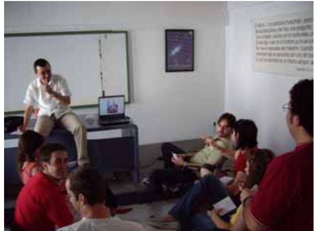
Reunión del jurado de fotografía