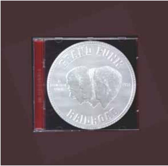
E Pluribus Funk. El mejor disco de Grand Funk Railroad

Los prolegómenos y el ambiente posterior al concierto tenían un punto tan interesante como el propio concierto. Ríos de jóvenes con indumentaria de hippies desfasados nos dirigíamos a la plaza de toros, campo de fútbol o local habilitado donde se realizaba el concierto. Veíamos los mismos personajes con ese “look” característico de otros conciertos. Buscábamos los metros cuadrados de nuestra manta en el lugar estudiado previamente, siempre buscando el estéreo (asunto muy importante), disfrutábamos de la unión común que a todos nos atraía, de los teloneros y de nuestros grupos preferidos. Una vez terminado el concierto nos íbamos a dormir a casa (dependiendo de la distancia), a algún parque, a la playa o a casa de algún amigo. Así estuvimos en Sevilla, Córdoba, Antequera, Écija, Málaga, Marbella, Puente Genil, Lucena, Almería, Granada, Cabra... y en nuestro pueblo con aquellos fantásticos conciertos de “La Uva Rock”.