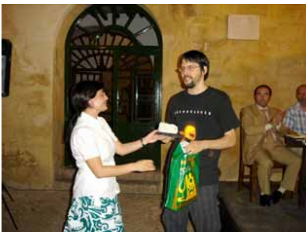
Entrega del primer premio de relato